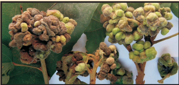
ट्रायोजा मेलोटिकोला (क्राफोर्ड) द्वारा संक्रमित मैलोटस फिलीपेंसिस की गॉलयुक्त पत्तियां