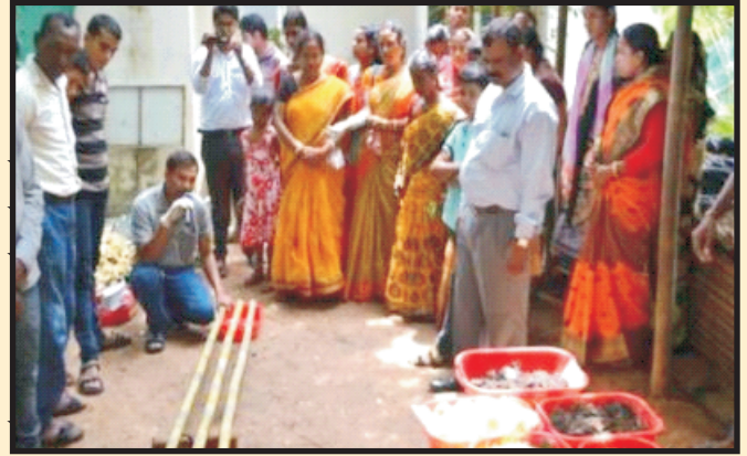
आजीविका के विस्तार पर व.आ.वि.के.,अगरतला में कार्यशाला