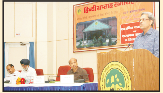
हिंदी सप्ताह समारोह के अवसर पर सभा को संबोधित करते महानिदेशक, भा.वा.अ.शि.प.