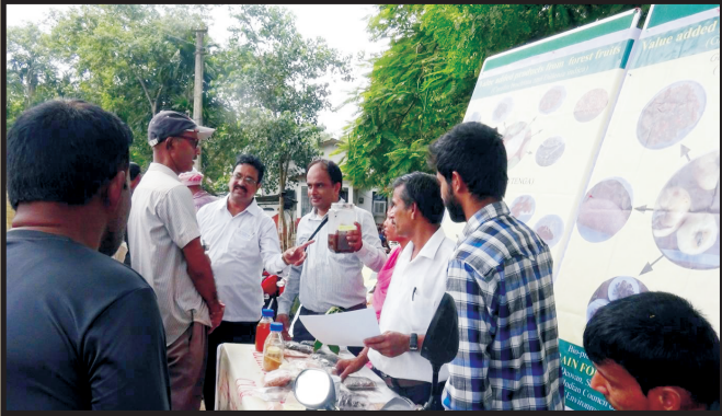
‘वनीय मशरूम की खेती’ पर प्रशिक्षण