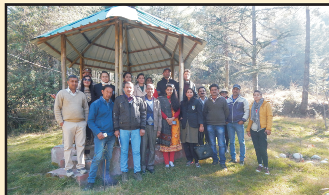
परती भूमियों के पारिपुनर्स्थापन पर प्रशिक्षण