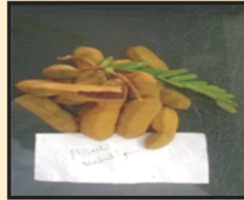
लाल इमली के अपरिपक्व फल