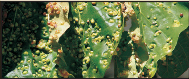
पारोप्साइला फिसिकोला कॉफिर द्वारा संक्रमित फाइक्स रॉक्सबर्घाई की गॉलयुक्त विकृत पत्तियां