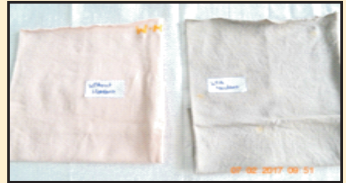
सुखाने के बाद कपड़े का रंग