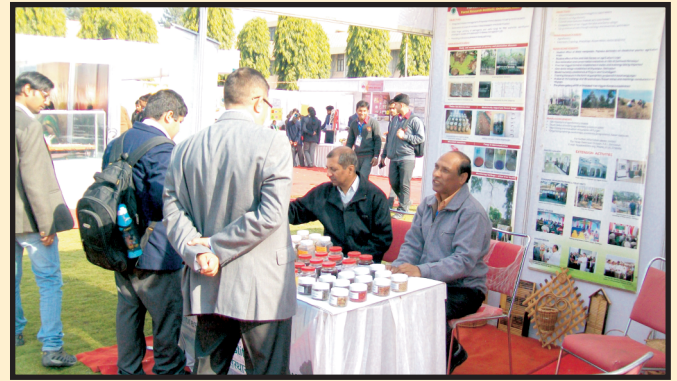
द्वितीय भारत अंतर्राष्ट्रीय विज्ञान मेला 2016 में व.अ.सं., देहरादून का स्टॉल