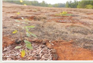
लैटराइट मृदाओं में रोपित एस. मैक्रोफाइला के पौधे