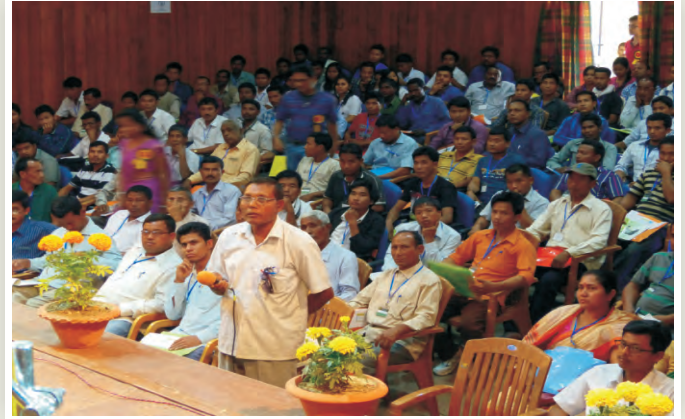
व.व.अ.सं., जोरहाट में वृक्ष उत्पादकों के मेले के भागीदारों के साथ पारस्परिक विचार-विमर्श सत्र