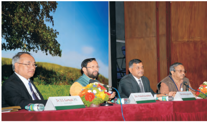
बंगलुरु में चिंतन शिविर

काष्ठ विज्ञान एवं प्रौद्योगिकी संस्थान (का.वि.प्रौ.सं.), बंगलुरु ने एन.आई.ए.एस., बंगलुरु में 08 तथा 09 फरवरी 2015 को चिंतन शिविर आयोजित किया। इसमें दक्षिण भारत के वन अधिकारियों, प्रदूषण बोर्ड तथा सम्बन्धित विभागों के वैज्ञानिकों ने भाग लिया और पर्यावरण, वन एवं जलवायु परिवर्तन मंत्रालय से सम्बन्धित विभिन्न पहलुओं पर विचार-विमर्श और आत्मनिरीक्षण किया।