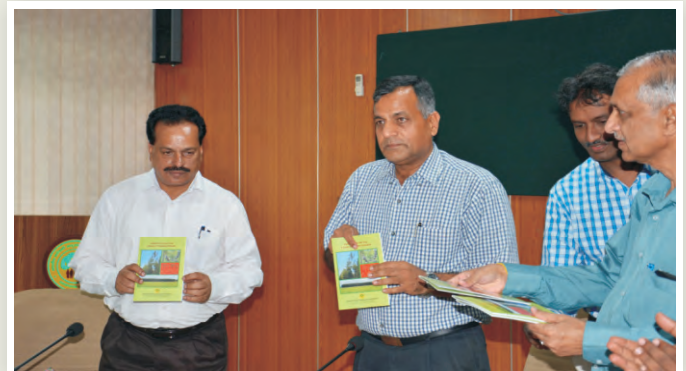
सचिव, पर्यावरण, वन एवं जलवायु परिवर्तन मंत्रालय द्वारा व.आ.वृ.प्र.सं., कोयम्बटूर में कैज्यूरियाना पर पुस्तिका का विमोचन

श्री अशोक लवासा, भा.प्र.से. सचिव, पर्यावरण, वन एवं जलवायु परिवर्तन मंत्रालय का 16 जून 2015 को व.आ.वृ.प्र.सं., कोयम्बटूर का दौरा एवं एक नये जैव कीटनाशक "क्रॉल क्लीन" जारी किया जिसे पपाया मीली बग के नियंत्रण हेतु संस्थान ने विकसित किया है। उन्होने "कैज्यूरियाना – नकदीफसल : लाभ योग्य खेती" पर एक पुस्तिका का विमोचन भी किया।