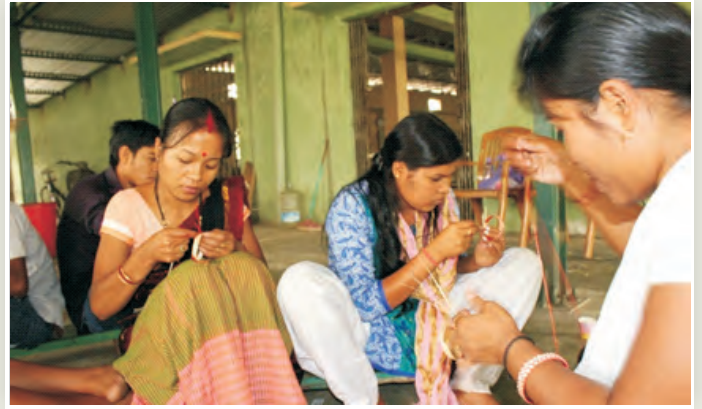
व.व.अ.सं., जोरहाट में बांस आभूषणों पर प्रशिक्षण