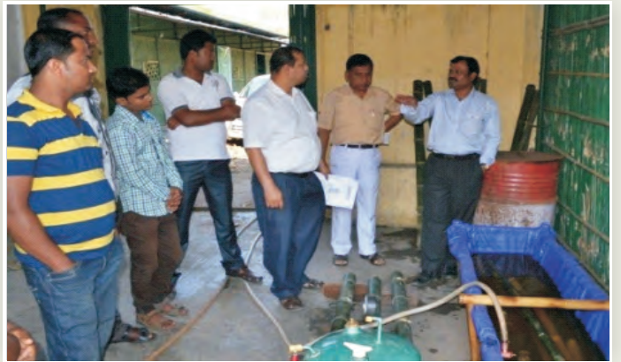
व.व.अ.सं., जोरहाट द्वारा बांस उपचार तकनीकों का प्रदर्शन