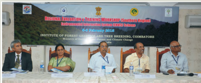
कोयम्बटूर में दक्षिणी क्षेत्र के इन्विस केन्द्र के लिए क्षेत्रीय मूल्यांकन एवं प्रशिक्षण कार्यशाला