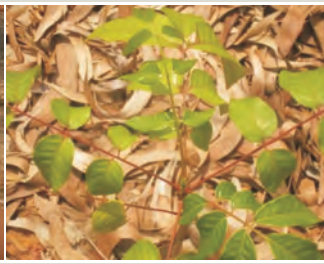
रोपित पौधों में उत्पन्न पत्तियां

व.अ.सं., देहरादून में फाईकस रॉक्सबर्घाई की पर्णविगलक साइल्लिड, एप्रोस्टोसिटस परजीवी पारोसाइला फिसीकोला की नई प्रजाति की पहचान की गई है।