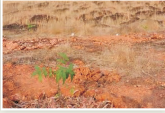
लैटराइट मृदाओं में रोपित ए. ट्राईफिसा के पौधे

पौधों में संचारित किया गया। संचारण के बाद ये पौधे लैटराइट मृदाओं को पोर्टिंग मीडिया के रूप में इस्तेमाल करते हुए उगाये गये। स्थल रोपण प्रदर्शन का अध्ययन करने के लिए सुधारित पौधों को बंजर लैटराइट मृदा वाली भूमियों में रोपित किया गया। न्यूनतम जलीय स्थितियों के बावजूद रोपित पौधों में नई पत्तियां और शाखायें आने लगी।