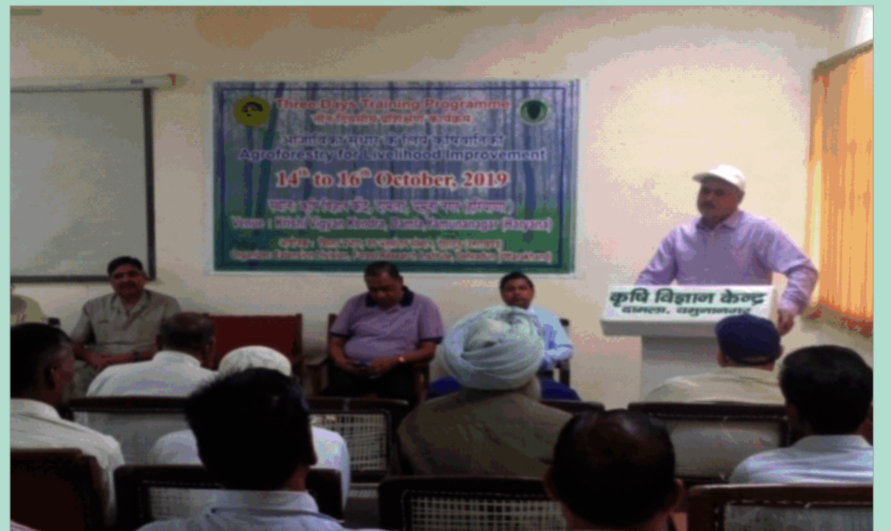
आजीविका सुधार के लिए कृषि वानिकी पर प्रशिक्षण