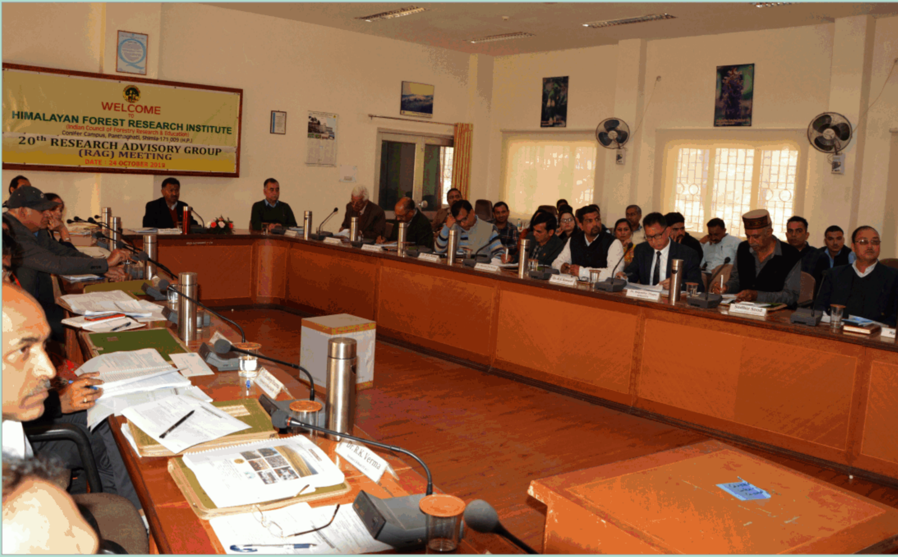
अनुसंधान सलाहकार समूह की बैठक