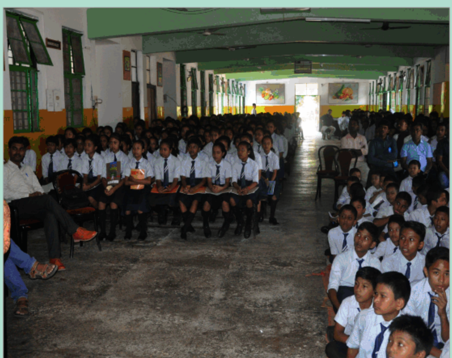
जवाहर नवोदय विद्यालय, शिवसागर, असम के छात्र