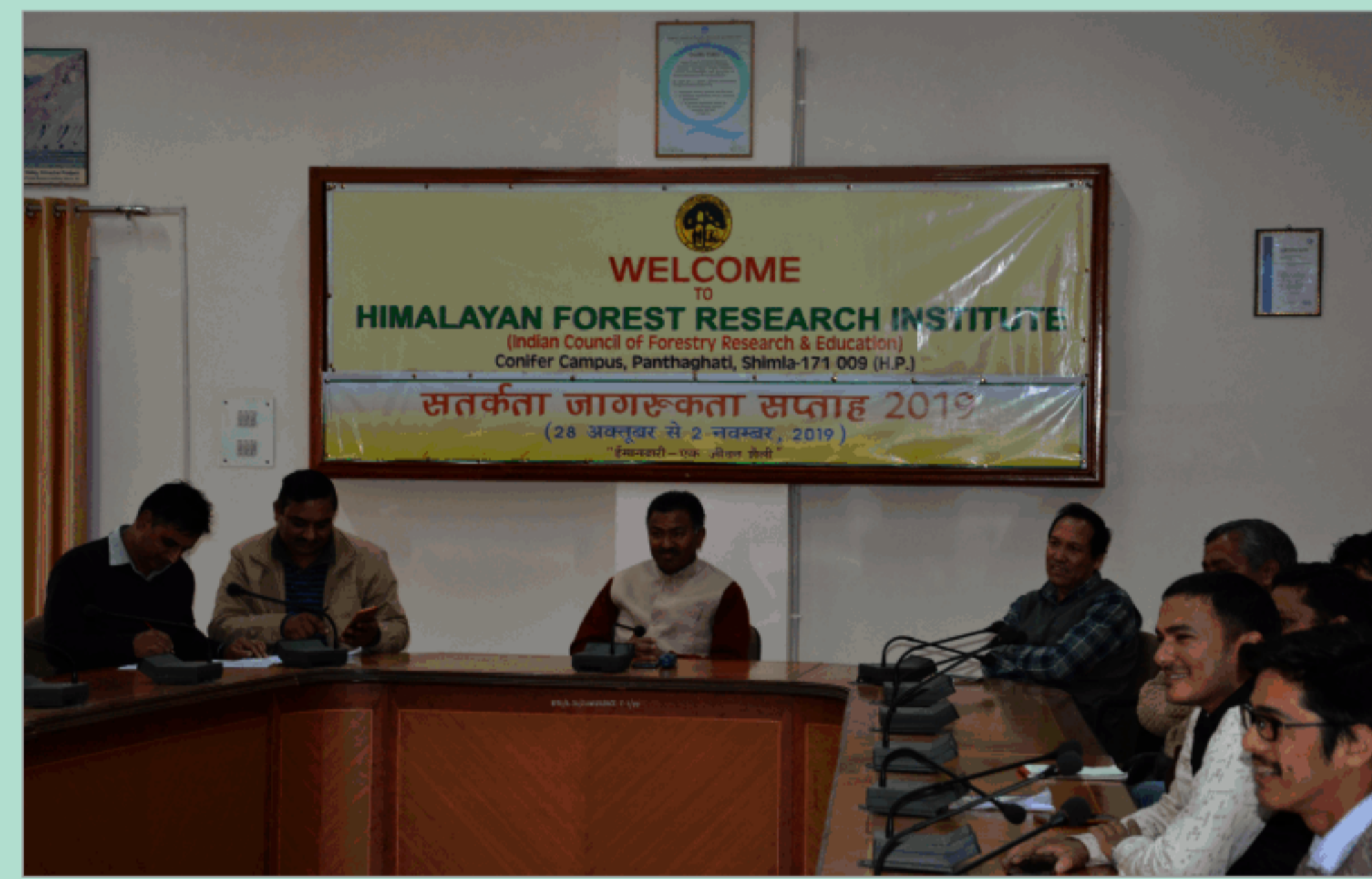
हि.व.अ.सं., शिमला में सतर्कता जागरूकता सप्ताह