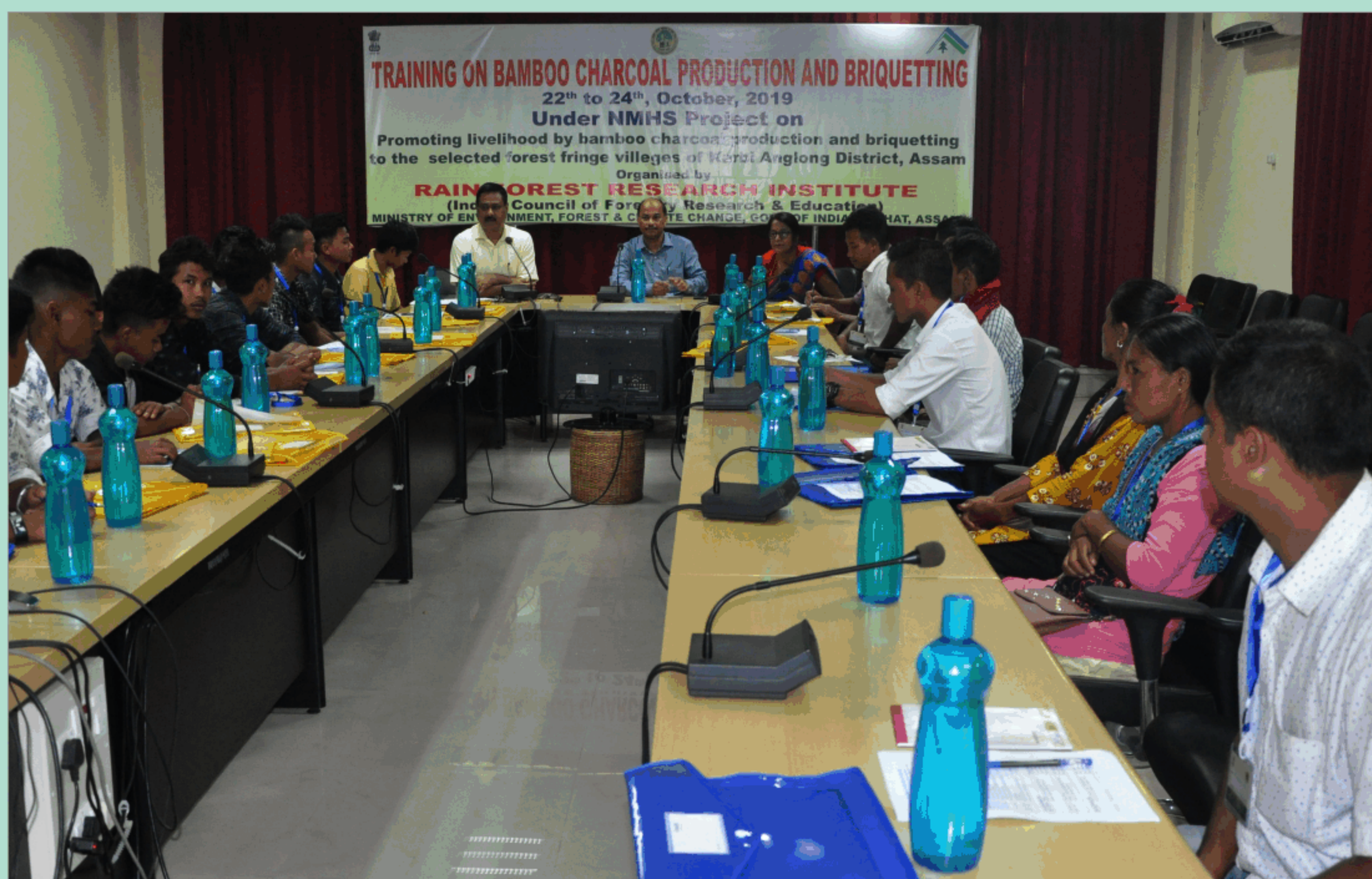
हिमालय अध्ययन पर राष्ट्रीय मिशन के अंतर्गत बाँस चारकोल उत्पादन तथा ब्रिकेटिंग पर प्रशिक्षण