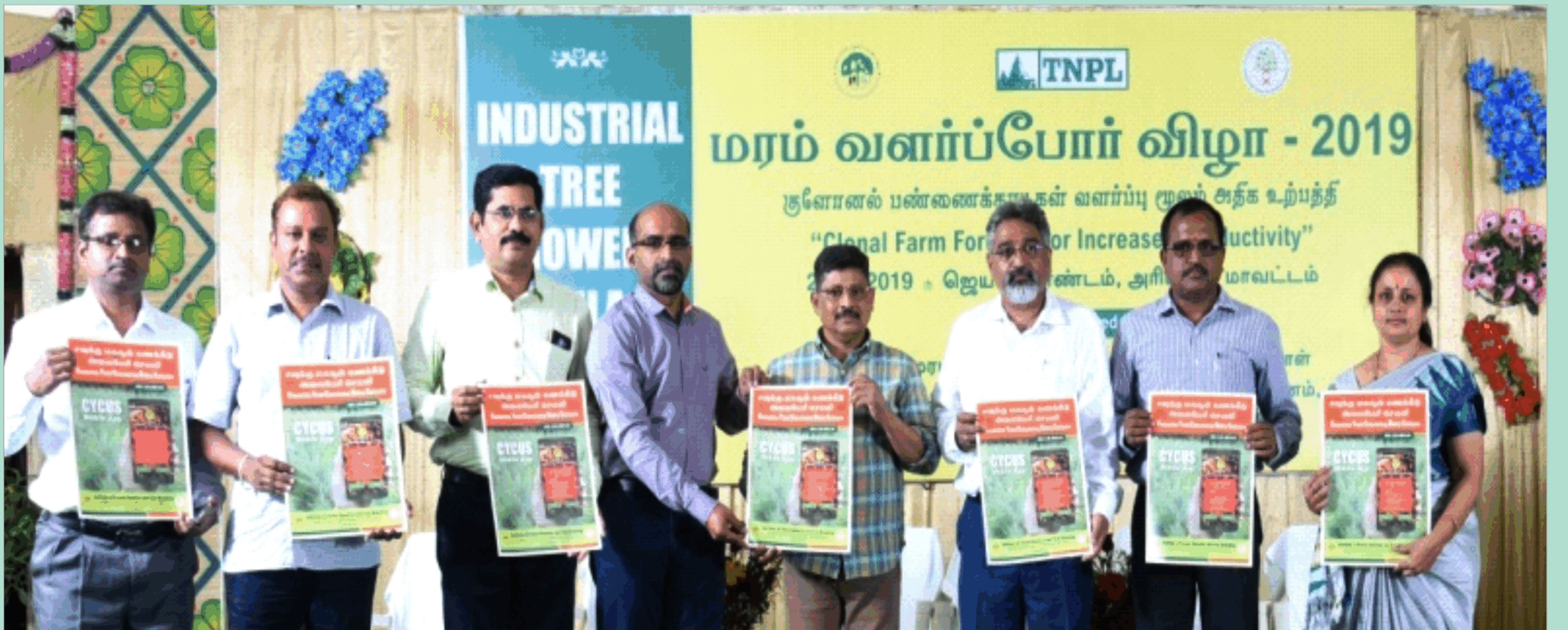
कैजुरिना रोपणियों में उपज आकलन के लिए कृषक हितैषी मोबाइल अनुप्रयोग का विमोचन