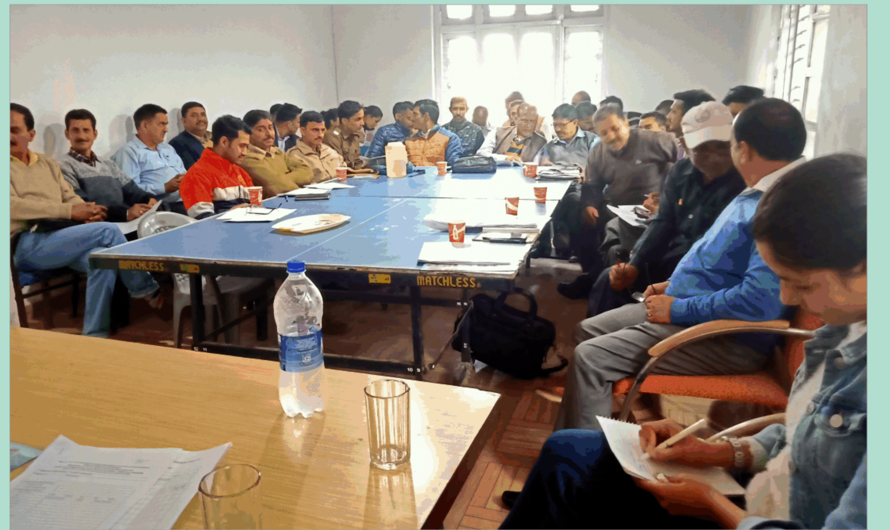
वानिकी हस्तक्षेपों के माध्यम से सतलज कावेरी नदी द्रोणी के जीर्णोद्धार के लिए विस्तृत परियोजना रिपोर्ट के निर्माण पर बैठक