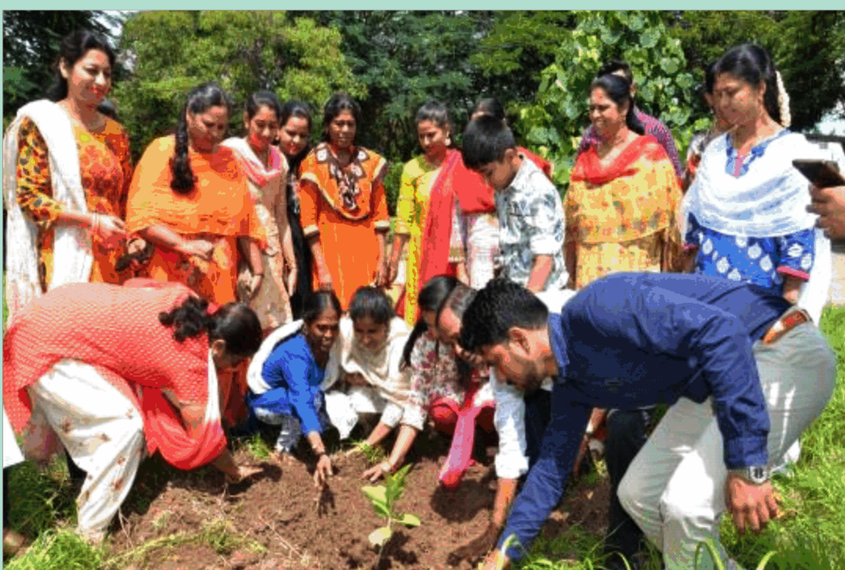
हरित दीपावली मनाने पर जागरूकता कार्यक्रम