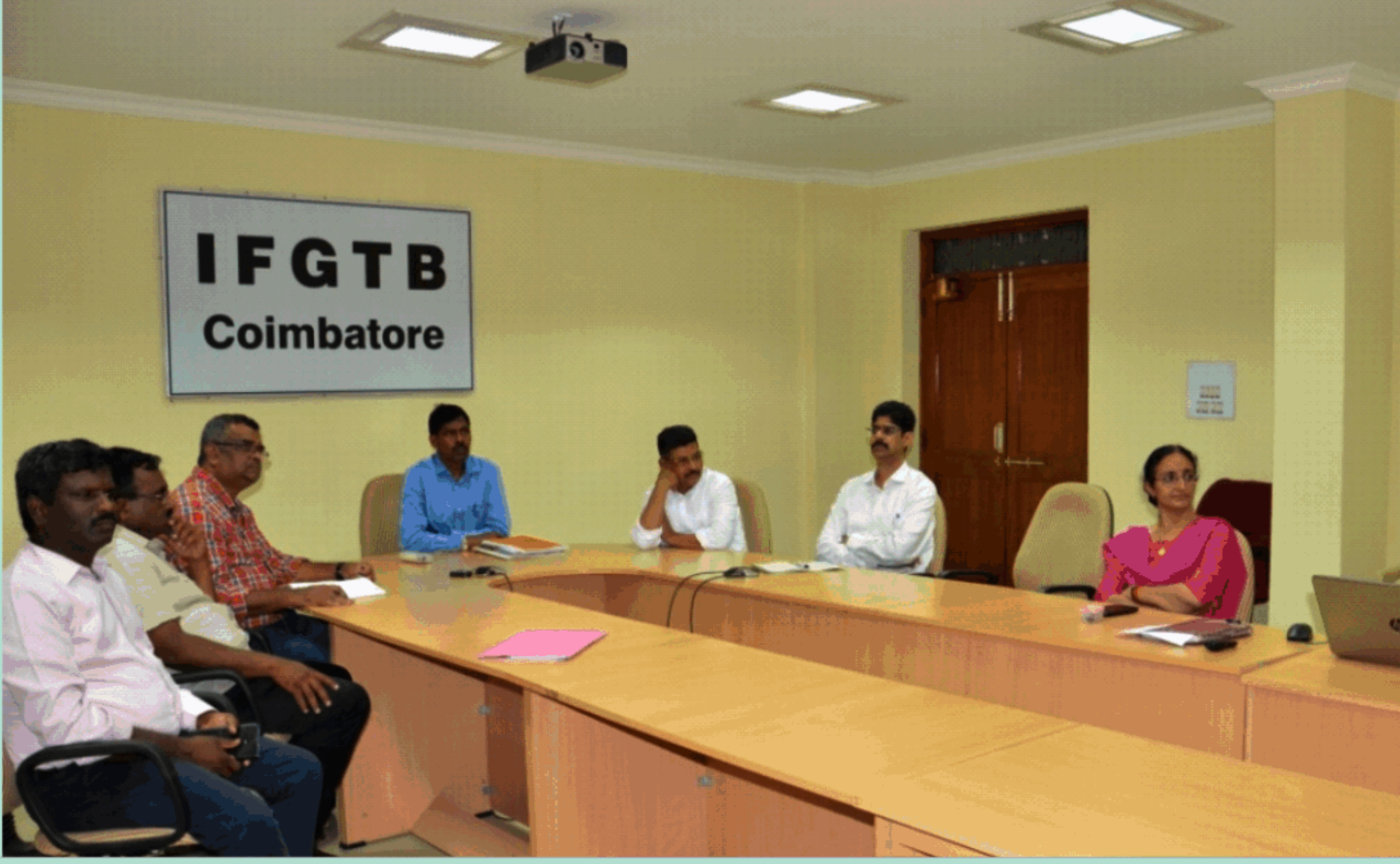
वानिकी हस्तक्षेपों के माध्यम से कावेरी नदी के जीर्णोद्धार के लिए विस्तृत परियोजना रिपोर्ट के निर्माण पर बैठक