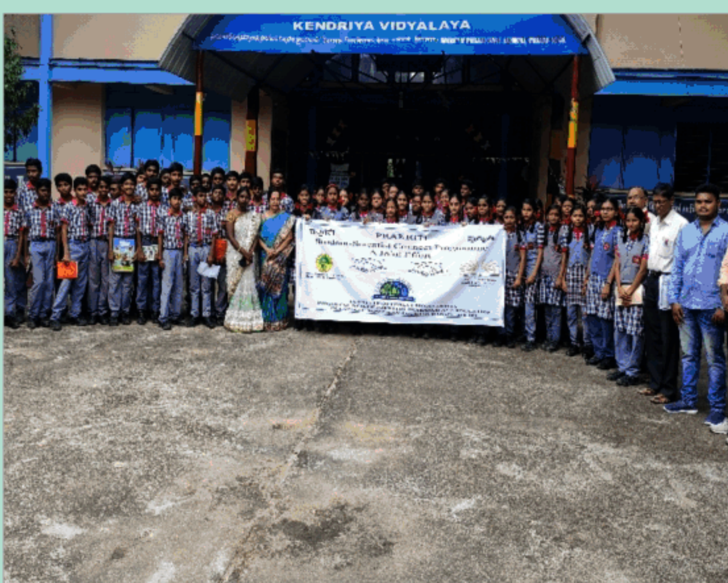
केन्द्रीय विद्यालय, हैदराबाद के छात्र