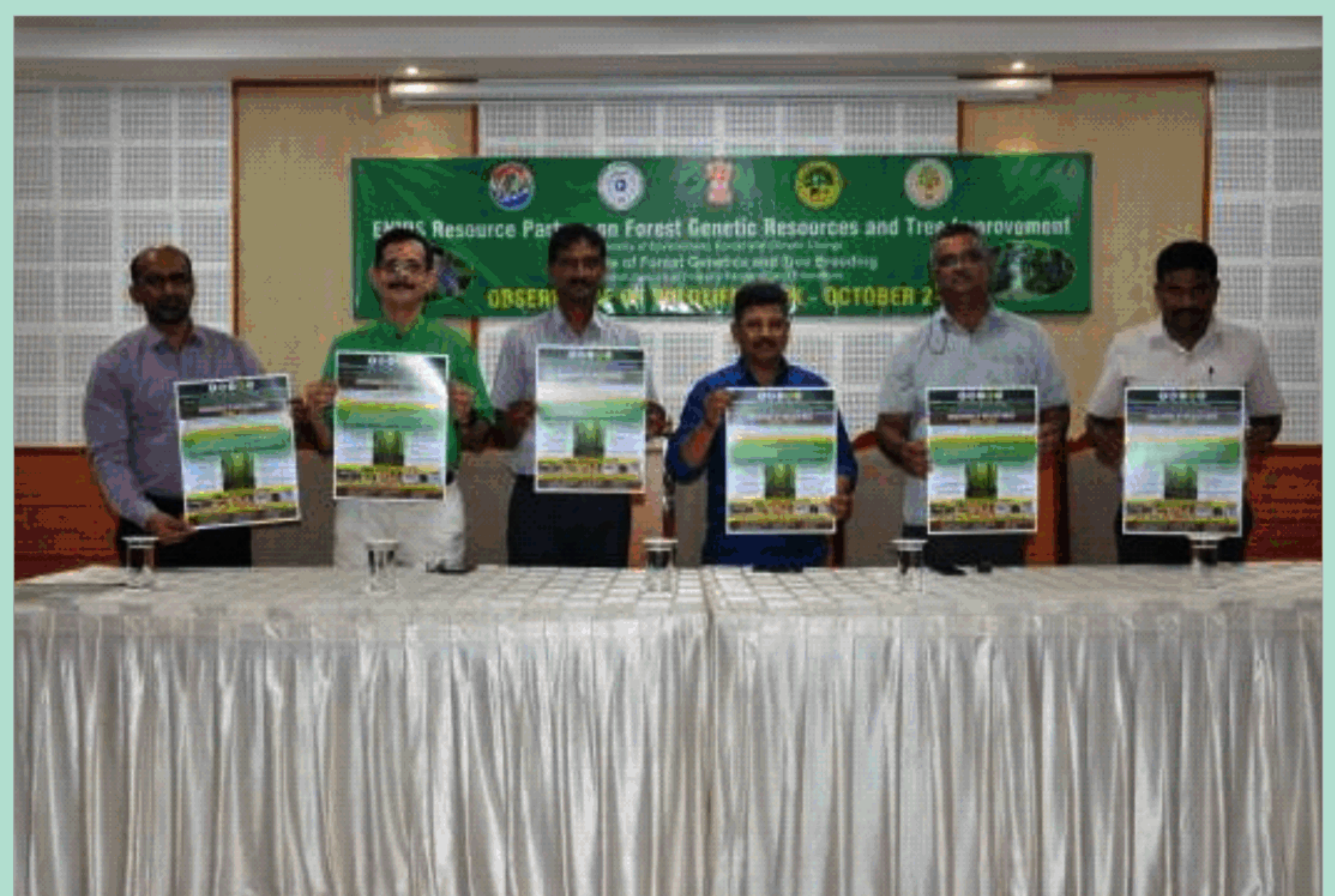
वन्यजीव सप्ताह का आयोजन