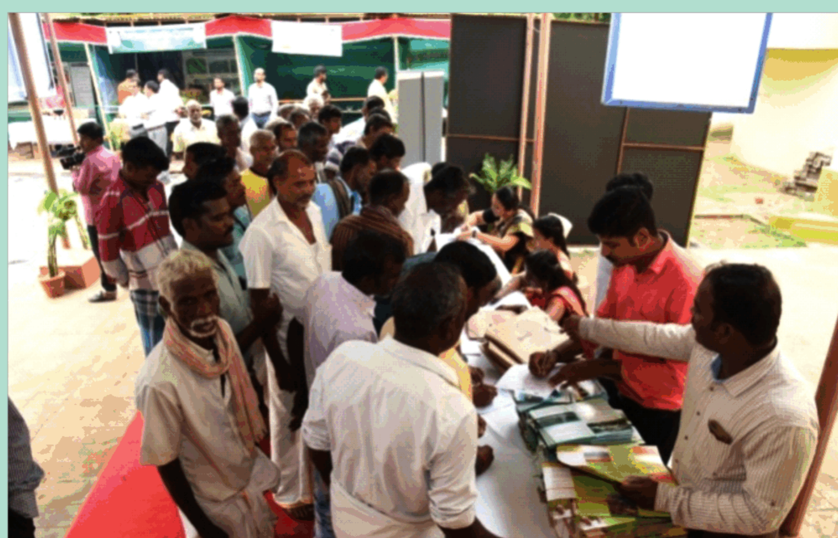
थिरुवन्नामलाई, तमिलनाडु में वृक्ष उत्पादक मेला