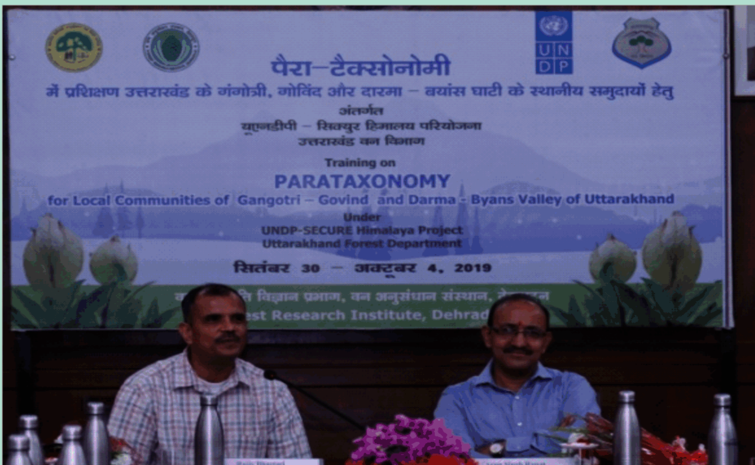
पैराटैक्सोनॉमी पर प्रशिक्षण