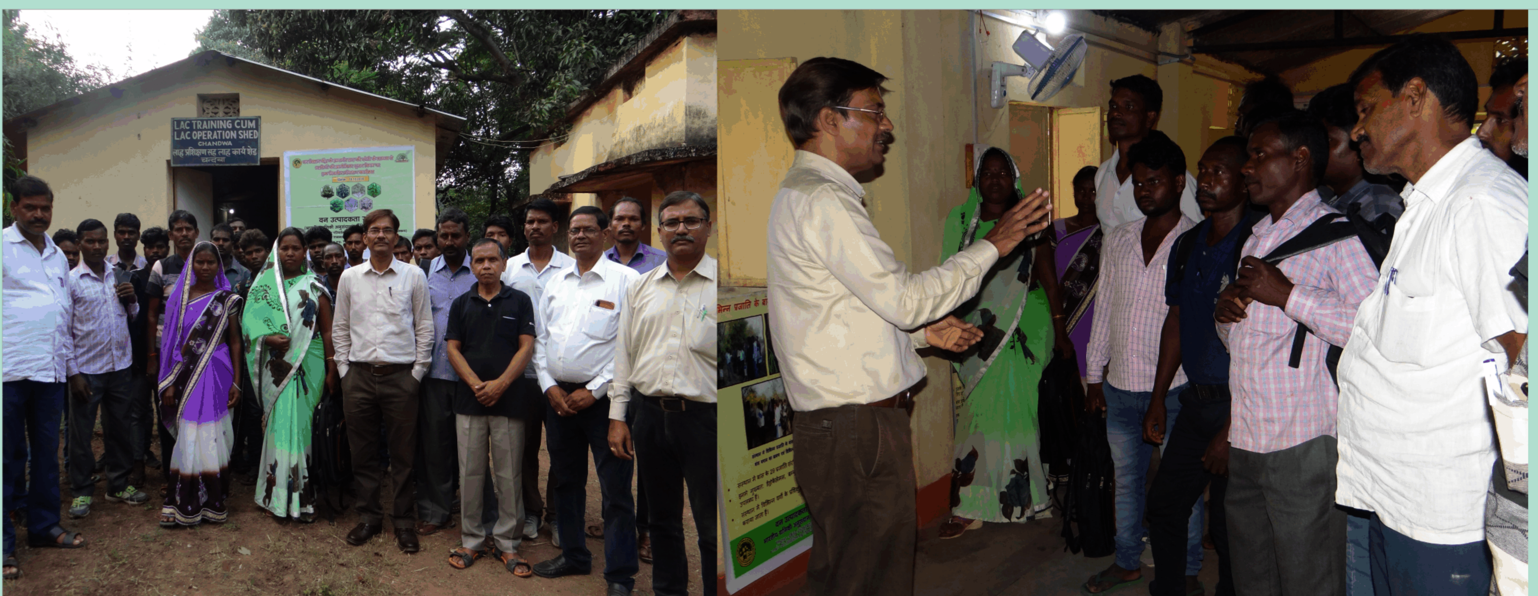
लाख कृषि के माध्यम से जीविका सृजन पर प्रशिक्षण