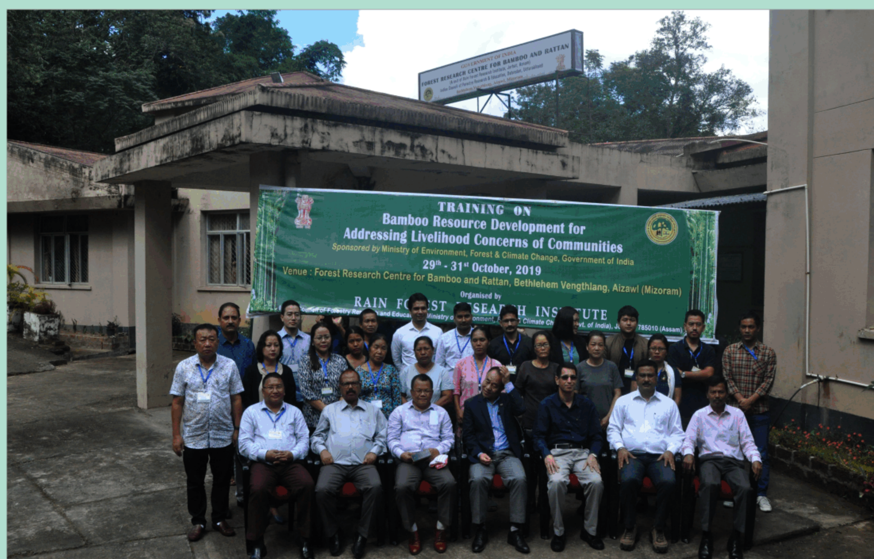
समुदायों की जीविका समस्याओं के संबोधन के लिए बाँस संसाधन विकास पर प्रशिक्षण