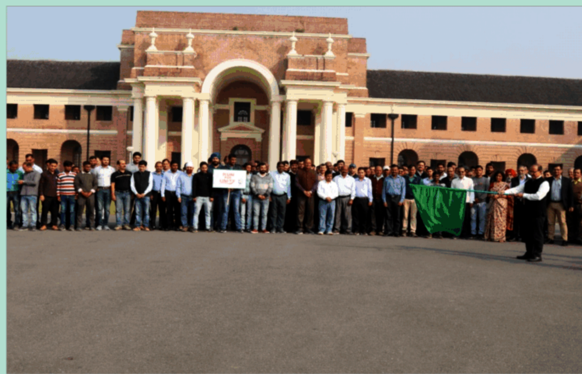
व.अ.सं., देहरादून में राष्ट्रीय एकता दिवस