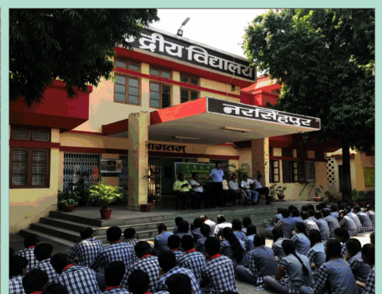
केन्द्रीय विद्यालय, नरसिंहपुर के छात्र