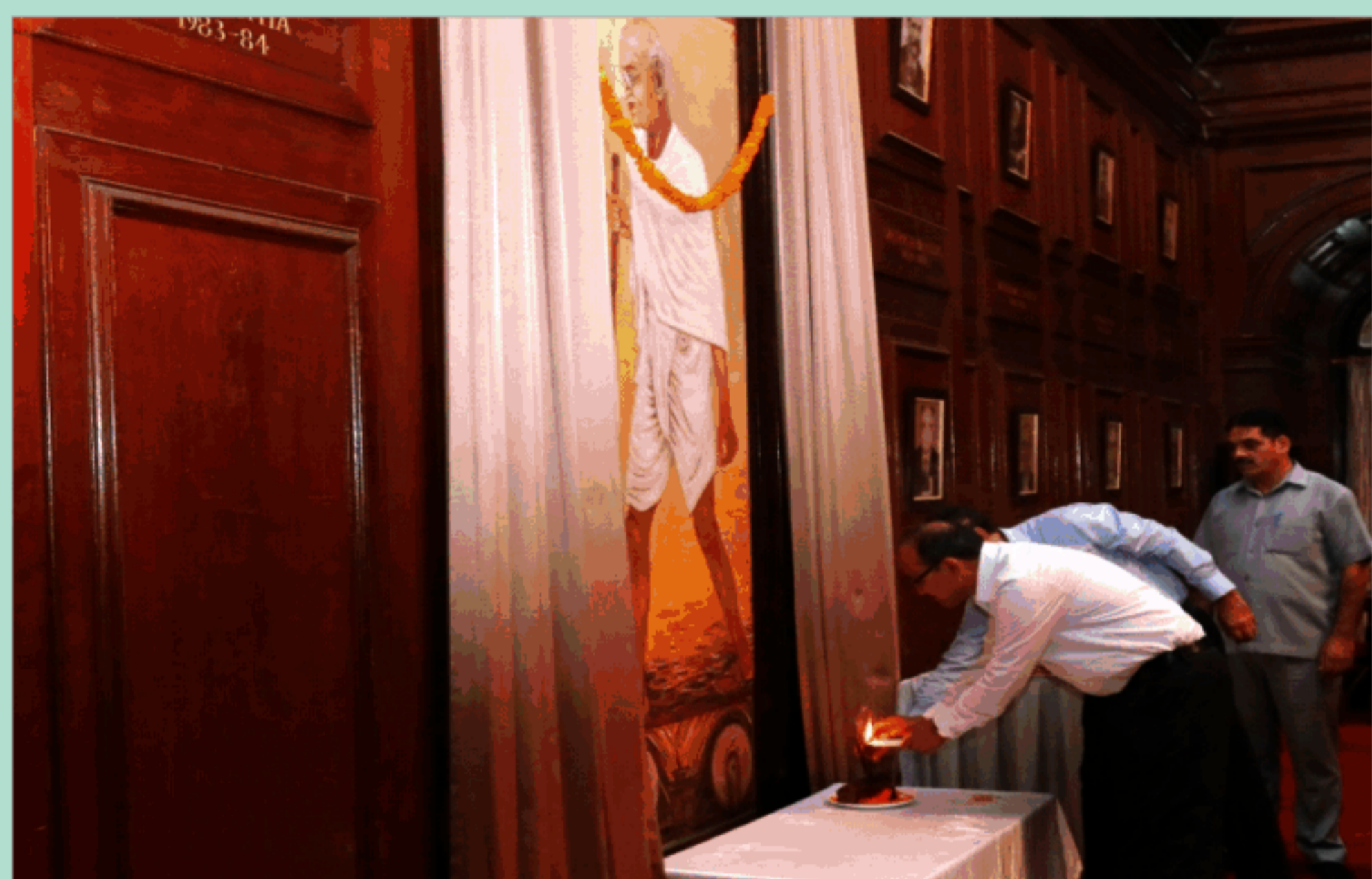
व.अ.सं., देहरादून में महात्मा गाँधी का 150 वाँ जन्मदिवस मनाया गया