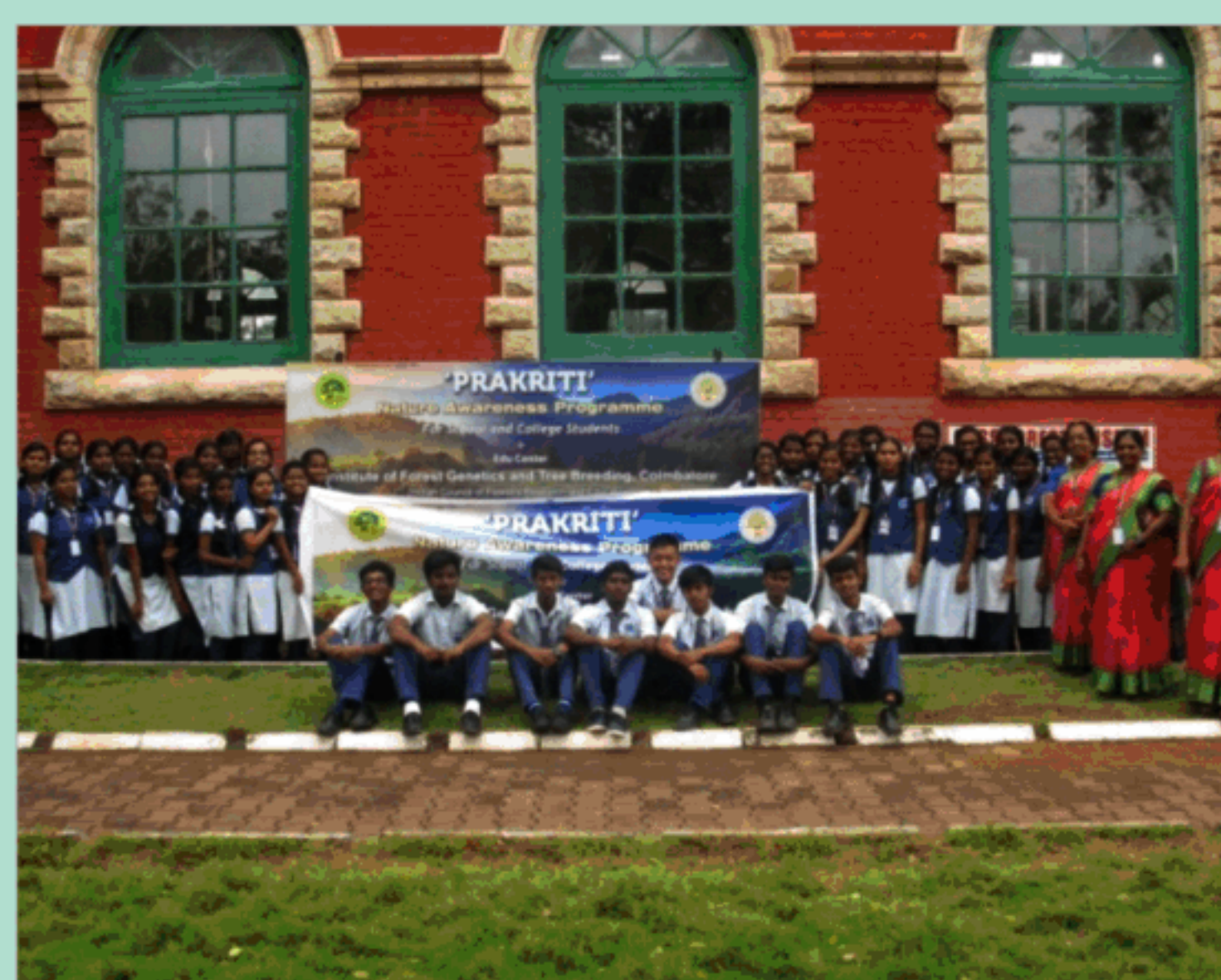
व.आ.वृ.प्र.सं. में प्रकृति कार्यक्रम के अंतर्गत छात्रों ने गॉस वन संग्रहालय का दौरा किया