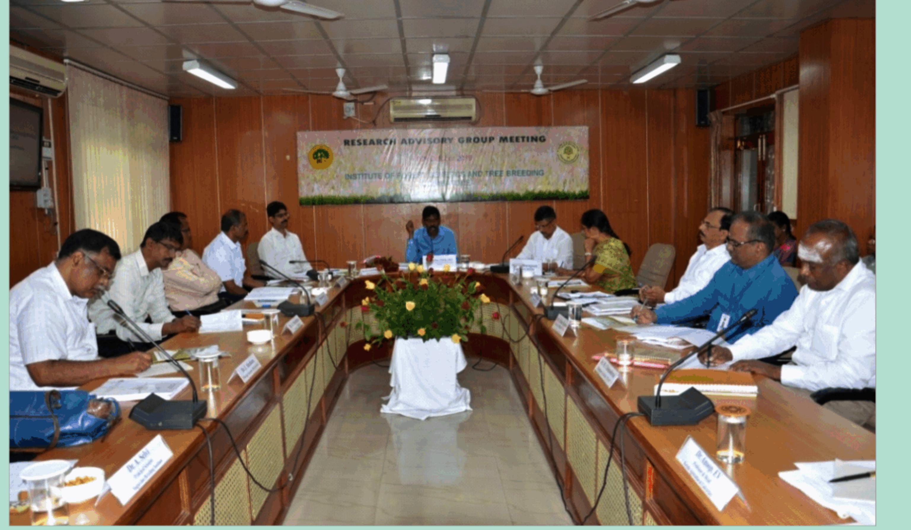
अनुसंधान सलाहकार समूह की बैठक