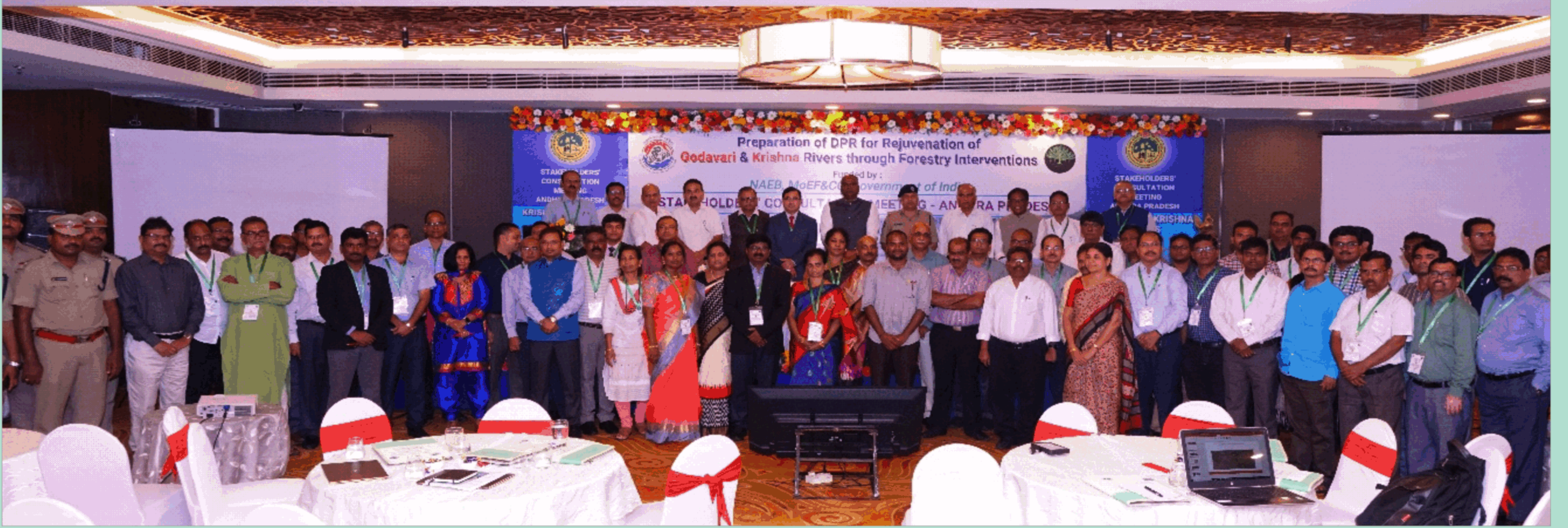
वानिकी हस्तक्षेपों के माध्यम से गोदावरी, नर्मदा तथा कृष्णा नदियों के जीर्णोद्धार के लिए विस्तृत परियोजना रिपोर्ट के निर्माण पर बैठक