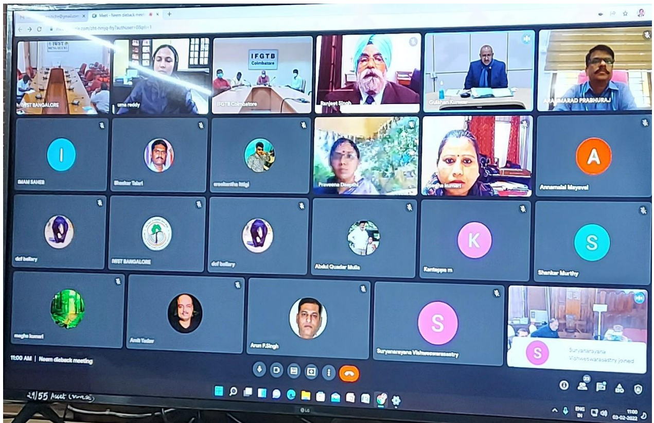
The DG, ICFRE, Dehradun addressed the gathering