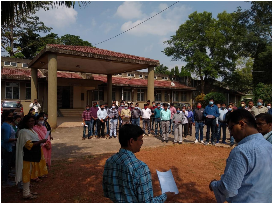
शपथ ग्रहण समारोह