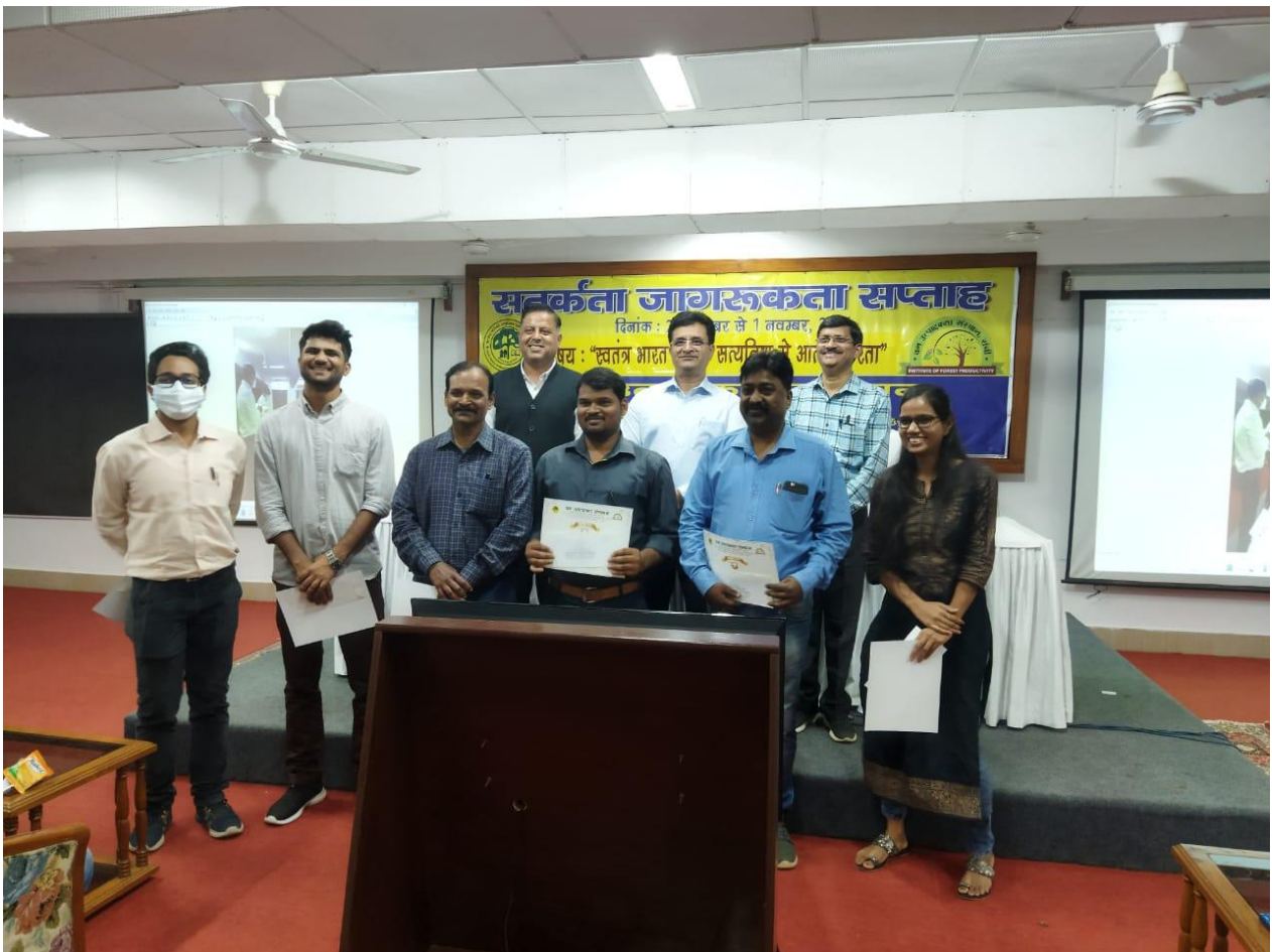
क्विज प्रतियोगिता के उप- विजेता