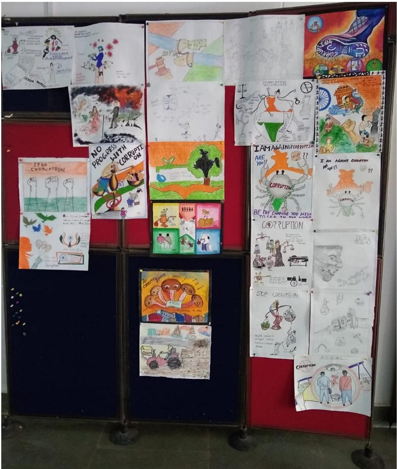
प्रतिभागियों की चित्र प्रदर्शन