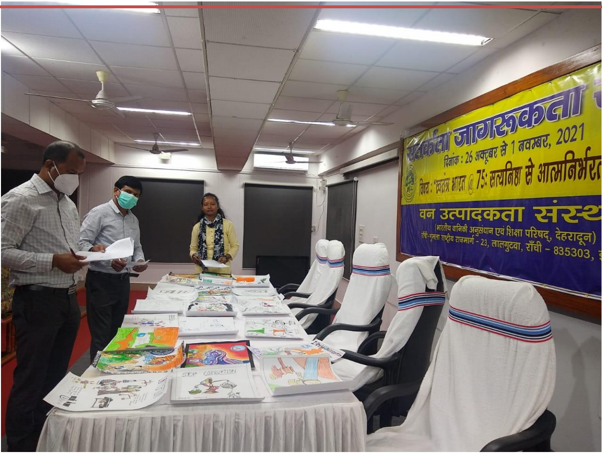
निर्णायक मण्डली द्वारा चित्रों का मूल्यांकन