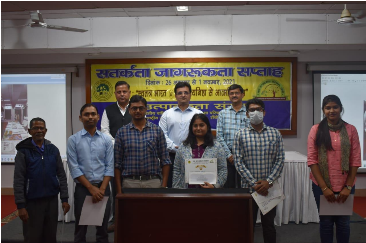
क्विज प्रतियोगिता के विजेता