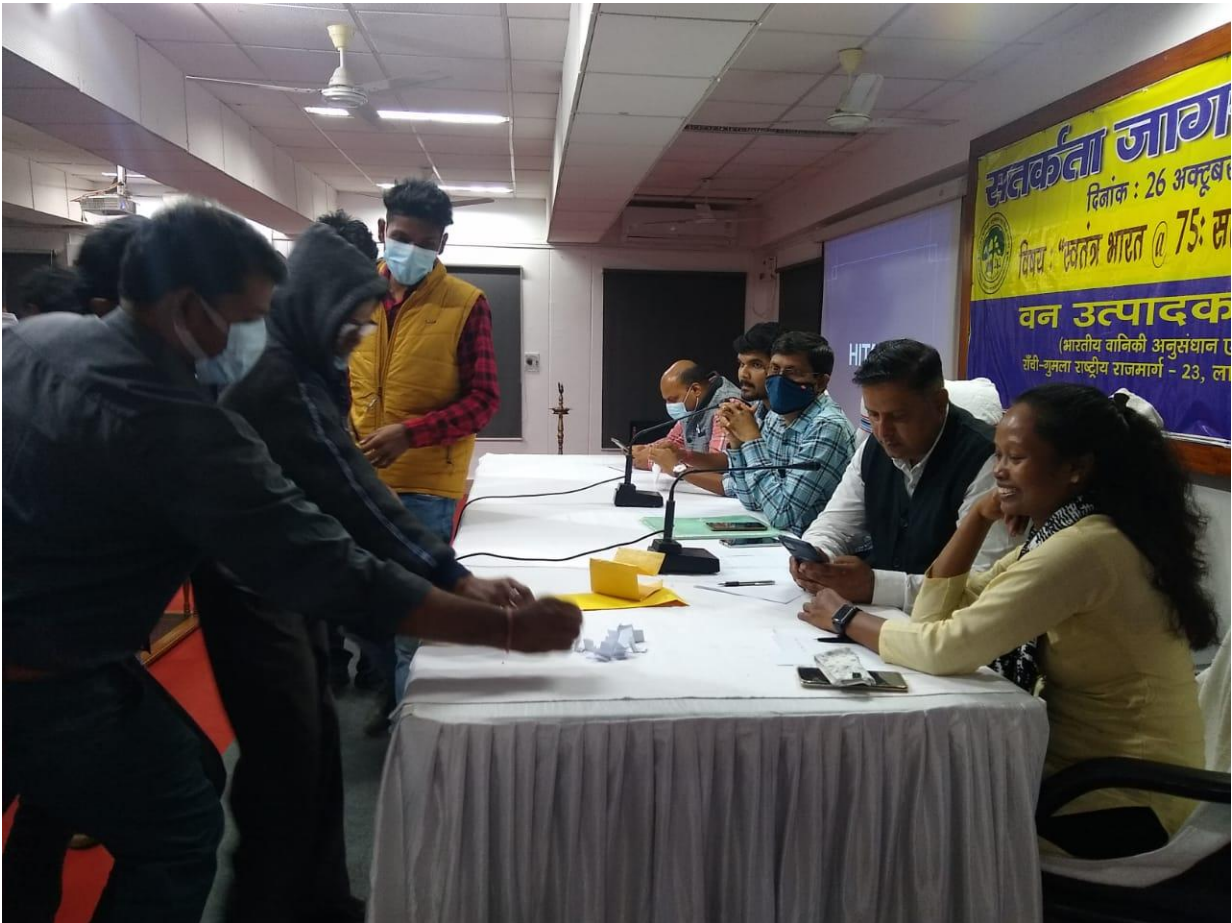
क्विज प्रतियोगिता के संचालकगन के समक्ष लॉटरी द्वारा ग्रूप विभाजन कि प्रक्रिया